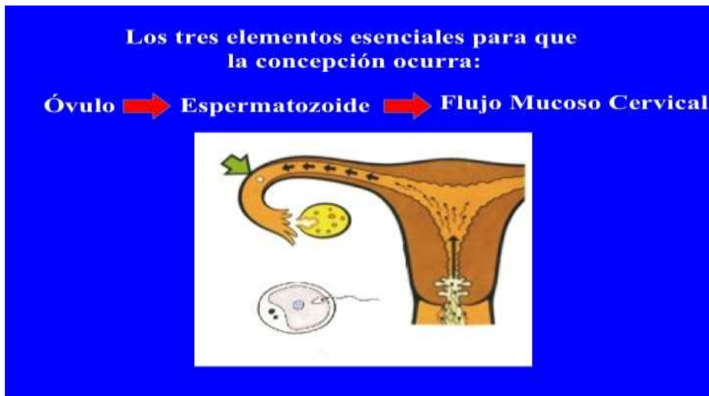
Fig. 1: Momento de la concepción

La concepción ocurre cuando el espermatozoide, la célula más pequeña del cuerpo humano y el óvulo, la célula más grande, se unen y comienza una nueva vida si Dios le transmite el alma (Fig. 1).