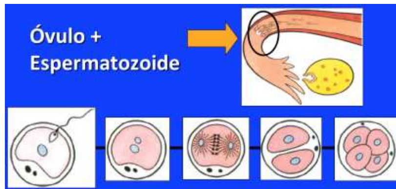
Fig. 3: Momento de la concepción

Inmediatamente después del momento de la concepción, cuando el óvulo y el esperma se han unido, las células del nuevo ser humano comienzan a dividirse y multiplicarse a una velocidad increíble (Fig. 3 y 4).