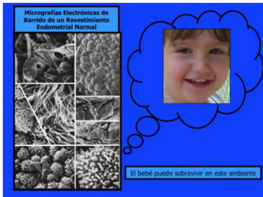
Fig. 6: Un bebé puede sobrevivir en un revestimiento endometrial normal

Después de la fecundación, en el cérvix, se forma un tapón de flujo mucoso cervical para ayudar a proteger al bebé en desarrollo hasta su nacimiento. El bebé crecerá en el útero durante los próximos 9 meses.