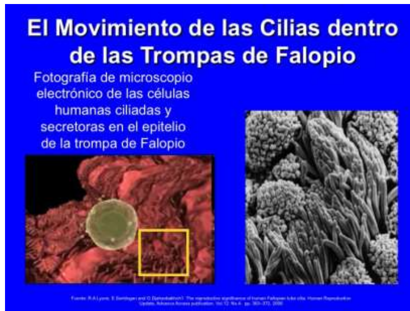
Fig. 5: Función de las ciliias en las Trompas de Falopio

Ahora la nueva y exclusiva vida se desplaza por la trompa de Falopio para implantarse en el revestimiento del útero, donde está rodeado de las células del endometrio (el cual proporciona protección y alimentación).