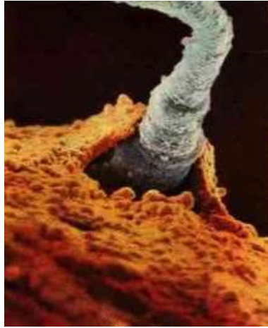
Fig. 2: Cuando lo invisible se vuelve visible

Inmediatamente después del momento de la concepción, cuando el óvulo y el esperma se han unido, las células del nuevo ser humano comienzan a dividirse y multiplicarse a una velocidad increíble (Fig. 3 y 4).